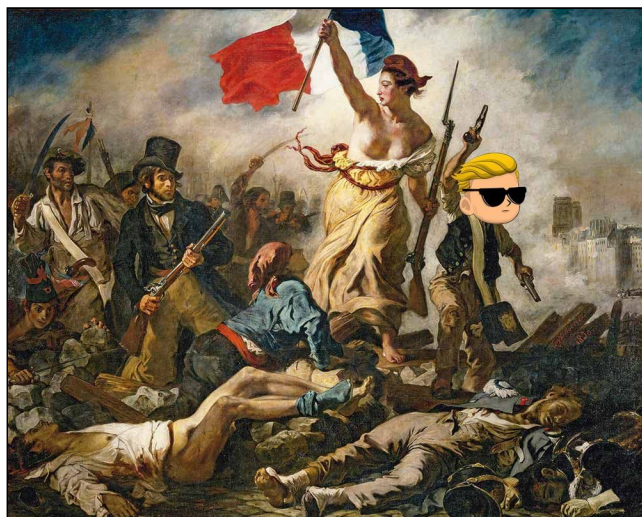
“Liberté, égalité, fraternité”... blockchain

Civicpower est la première plateforme 9 de vote sécurisée par un mécanisme de Blockchain, facilement utilisable par tout le monde, tout en permettant de préserver le secret du vote et la confidentialité des votants.